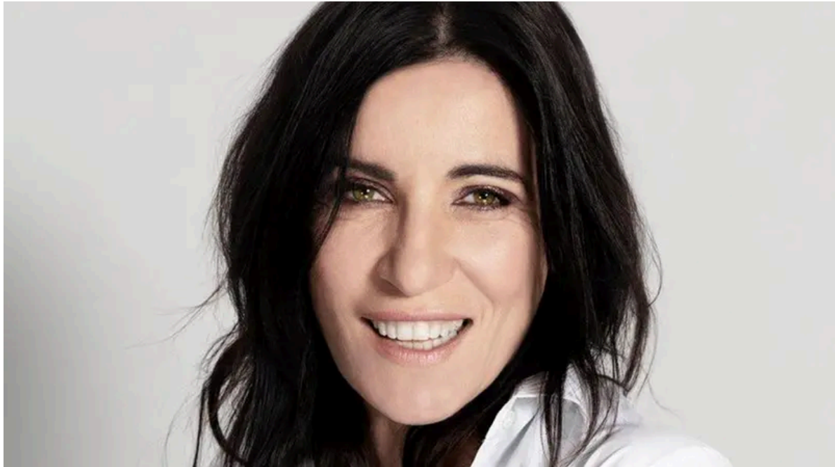
Paola Turci, presente alla manifestazione di quest'anno

Inoltre il 7 marzo si terrà un hackathon a cui parteciperanno 18 scuole e 20 imprenditori . Si aggiunge a questi anche il percorso esperienziale sulla «Voglia di Futuro», condotto con strumenti interattivi e intergenerazionali .