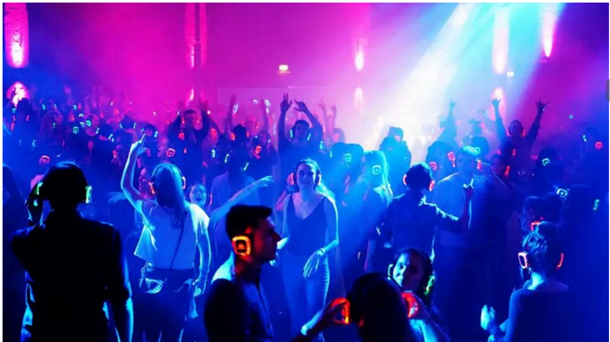
Un silent party